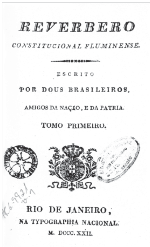
O jornal Reverbero Constitucional Fluminense tornou-se um órgão doutrinário da Independência brasileira

Também nesse ano, a 18 de dezembro, surgiria um novo jornal que, juntamente