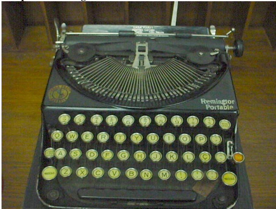
Figura n. 9 Maquina de datilografia final do século XIX e Início do séculoXX