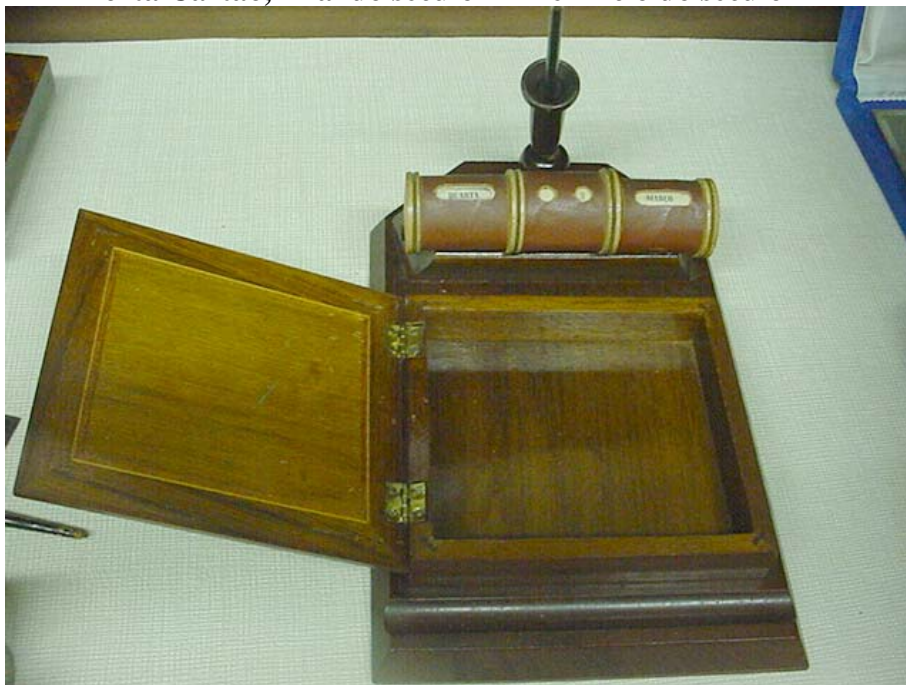
Figura n. 10 Porta Cartão, final do século XIX e Início do século XX