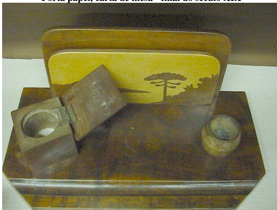
Figura n. 13 Porta papel, carta de mesa - final do século XIX