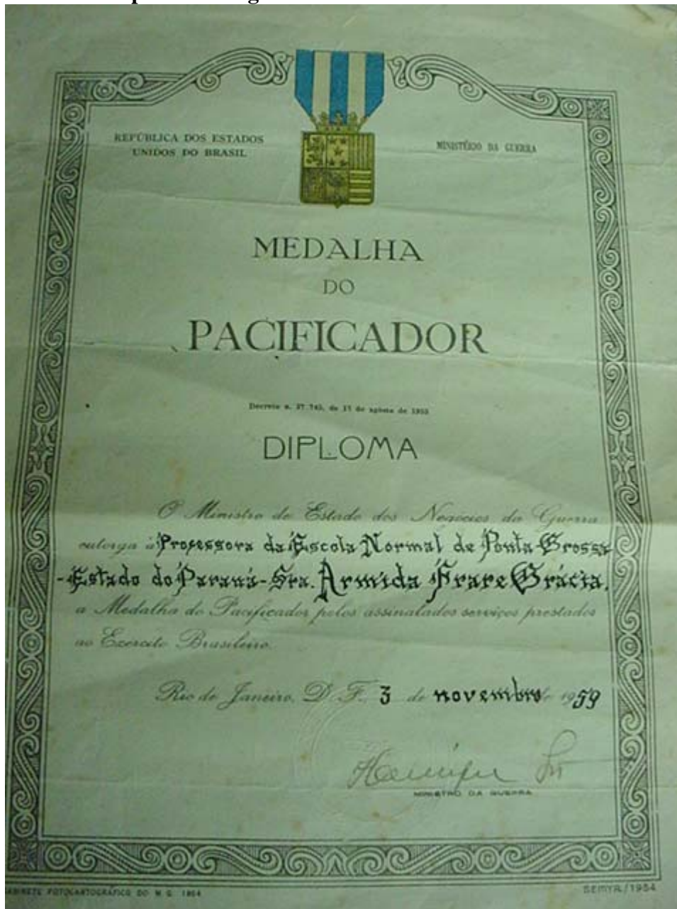
Figura n. 11 Diploma entregue a aluno da escola Normal 1959