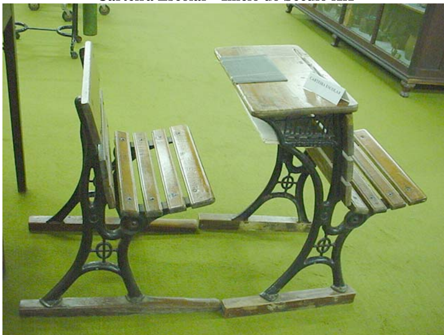
Figura n. 15 Carteira Escolar - Início do Século XX