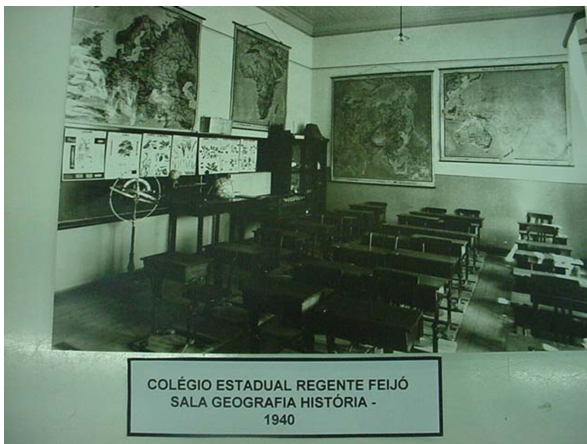
Figura n. 6 Interior da Sala de Aula da Escola Regente Feijó- Início do Século XX