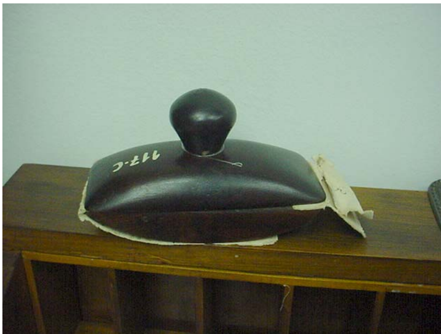
Figura n. 8 Mata Borrão de Ferro final do século XIX e início do século XX