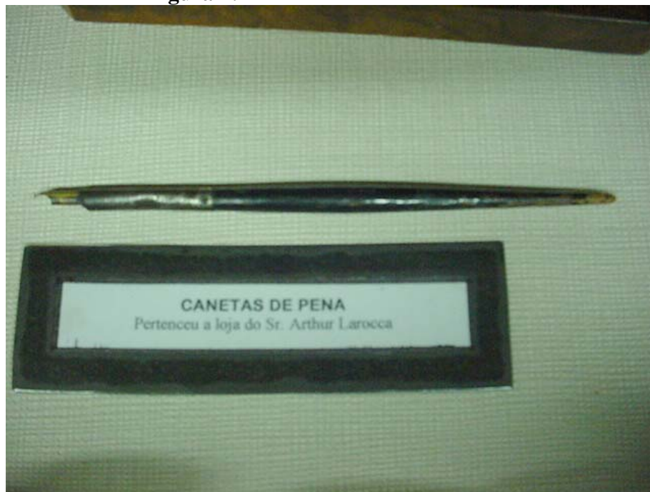
Figura n. 12