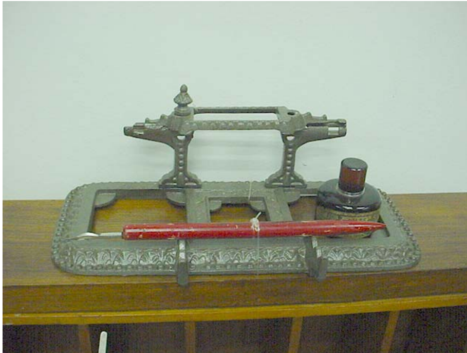
Figura n. 7 Porta Tinteiro final do século XIX e Início do século XX.