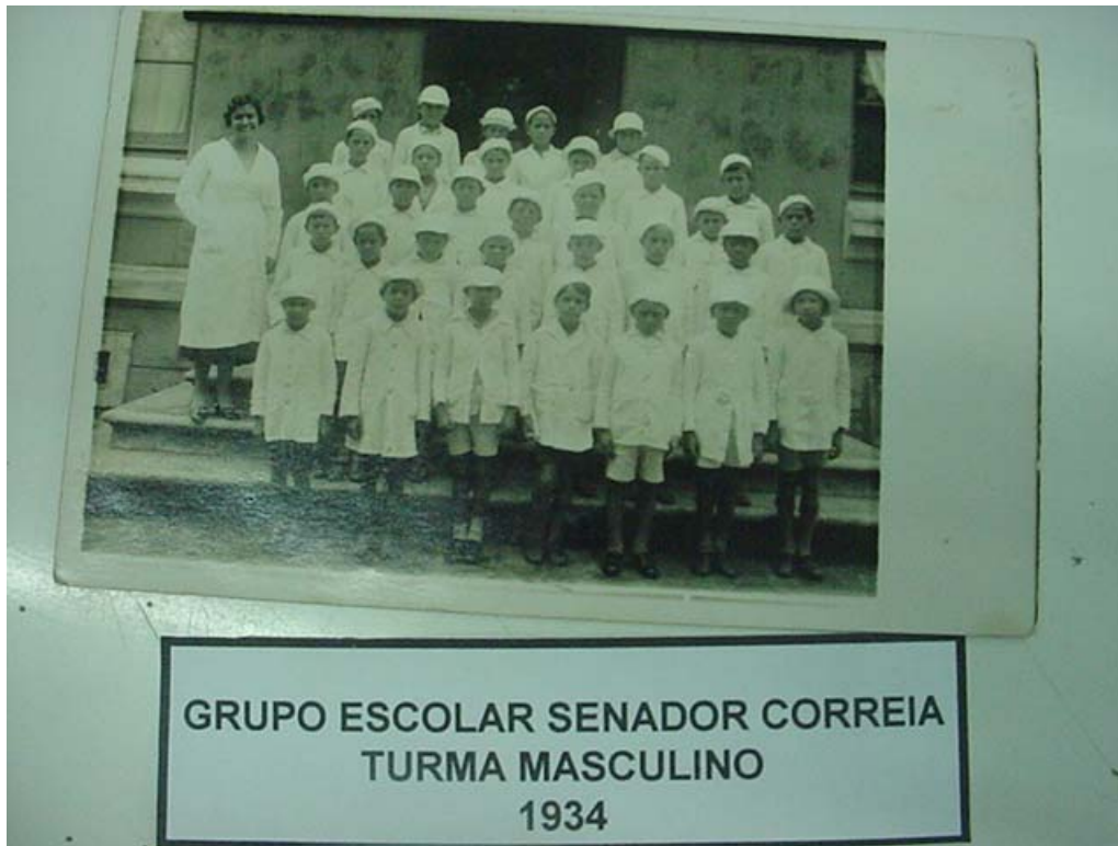
Figura n.4 Alunos e professora do Grupo Escolar Senador Correia Ponta Grossa 1927