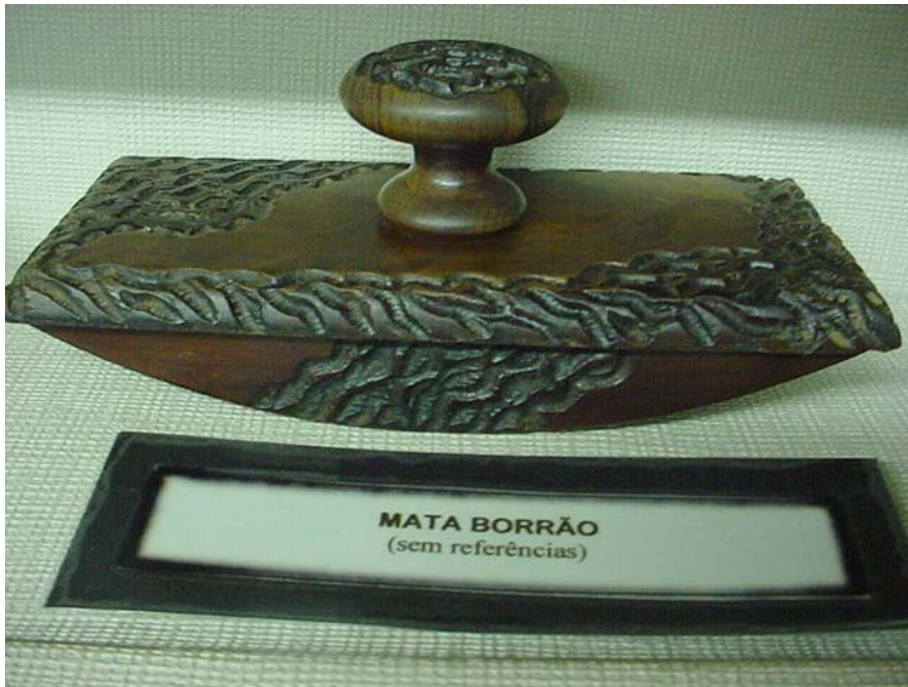
Figura n. 14 Mata Borrão final do século XIX